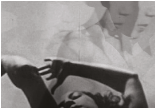
Karmachina, Homage to Maya

> performance videomusicale e incontro con l'autore