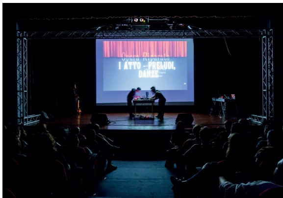
Økapi, Opera Riparata

Opera Riparata è un omaggio a Bruno Munari e alla sua Opera rotta (ideata insieme a Davide Mosconi). Partendo dal testo scritto nel 1989 da Munari e Mosconi, il musicista Filippo E. Paolini (Økapi) e il videoartista Simone Memè destrutturano e ricompongono 40 opere celebri della musica lirica secondo la contemporanea logica del remix digitale (ritaglio, scomposizione, giustapposizione e sovrapposizione).